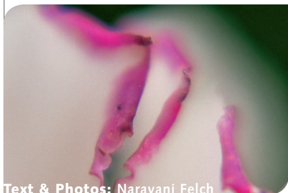
Text & Photos: Narayani Felch